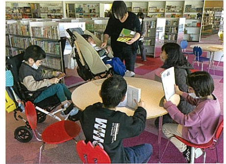
▲校外学習（図書館に行こう）